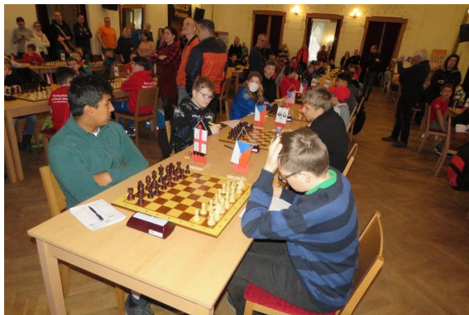
3 Sál Turnajů šachových nadějí plný hráčů

IČ: 495 62 517, Jana Čapka 3098, 738 01 Frýdek-Místek bankovní spojení: FIO banka, č. účtu: 7749562517/2010 sekretariat@chessfm.cz , www.chessfm.cz