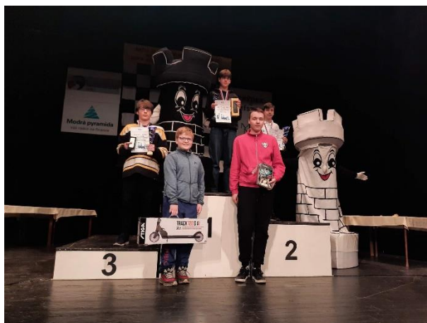
8 Vyhlášení Turnajů šachových nadějí - chlapci do 15 let