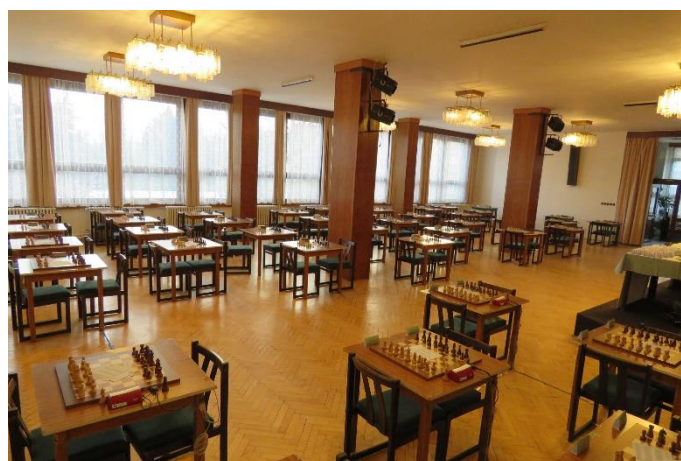
2 Sál Turnajů Pobeskydí

V letošním roce jsme kromě tradičních turnajů v kategoriích do 9, 12, 15 let a Open turnaje Pobeskydí pro širokou šachovou veřejnost uspořádali i uzavřený turnaj Pobeskydí, ve kterém bylo možné uhrát normu mezinárodního mistra. Všechny turnaje se nakonec zúčastnilo 217 hráčů z 11 států. Více povědí statistiky účasti v následující tabulce: