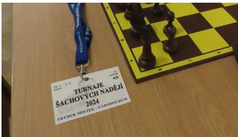
14 - Pozvánka na 43. ročník festivalu Turnaje šachových nadějí

Přestože 42. ročník byl ukončen, naše práce nekončí. Již nyní se připravuje 43. ročník, který se uskuteční 28. 3. – 1. 4. 2024.