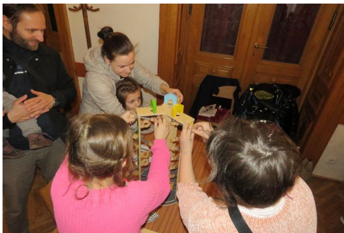
6 Doprovodný program - stolní hry

Široká šachová i laická veřejnost, anebo účastníci turnajů, kteří si chtěli od šachu odpočinout, měl možnost si zahrát mnoho stolních a deskových her. Všichni, kdo absolvovali všechny stanoviště a hry si vyzkoušeli, obdrželi sladkou odměnu.