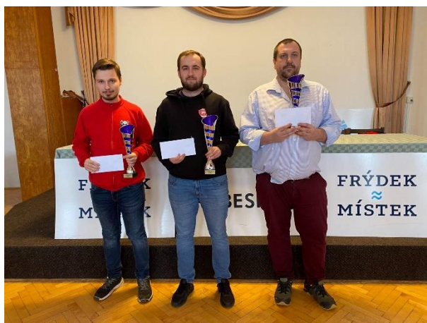
10 Vyhlášení Open Pobeskydí

IČ: 495 62 517, Jana Čapka 3098, 738 01 Frýdek-Místek bankovní spojení: FIO banka, č. účtu: 7749562517/2010 sekretariat@chessfm.cz , www.chessfm.cz