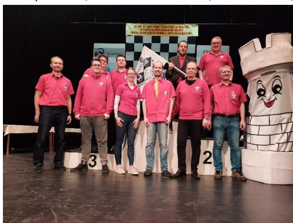
13 Pořadatelský tým festivalu Turnaje šachových nadějí