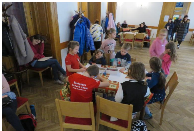
4 Soutěž Picasso TŠN

Kromě samotných šachových turnajů proběhlo mnoho doprovodných akcí. Před pátečním odpoledním kolem proběhlo vyhlášení výsledků Grand Prix Moravskoslezského šachového svazu v rapid šachu. Dále po celou dobu bylo možné přihlásit své malířské výtvary do soutěže Picasso TŠN.