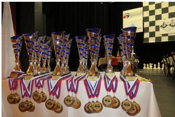
7 Poháry a medaile pro nejlepší v turnajích

IČ: 495 62 517, Jana Čapka 3098, 738 01 Frýdek-Místek bankovní spojení: FIO banka, č. účtu: 7749562517/2010 sekretariat@chessfm.cz , www.chessfm.cz