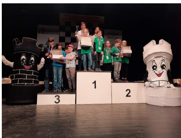
9 - Vyhlášení Turnajů šachových nadějí - soutěž družstev